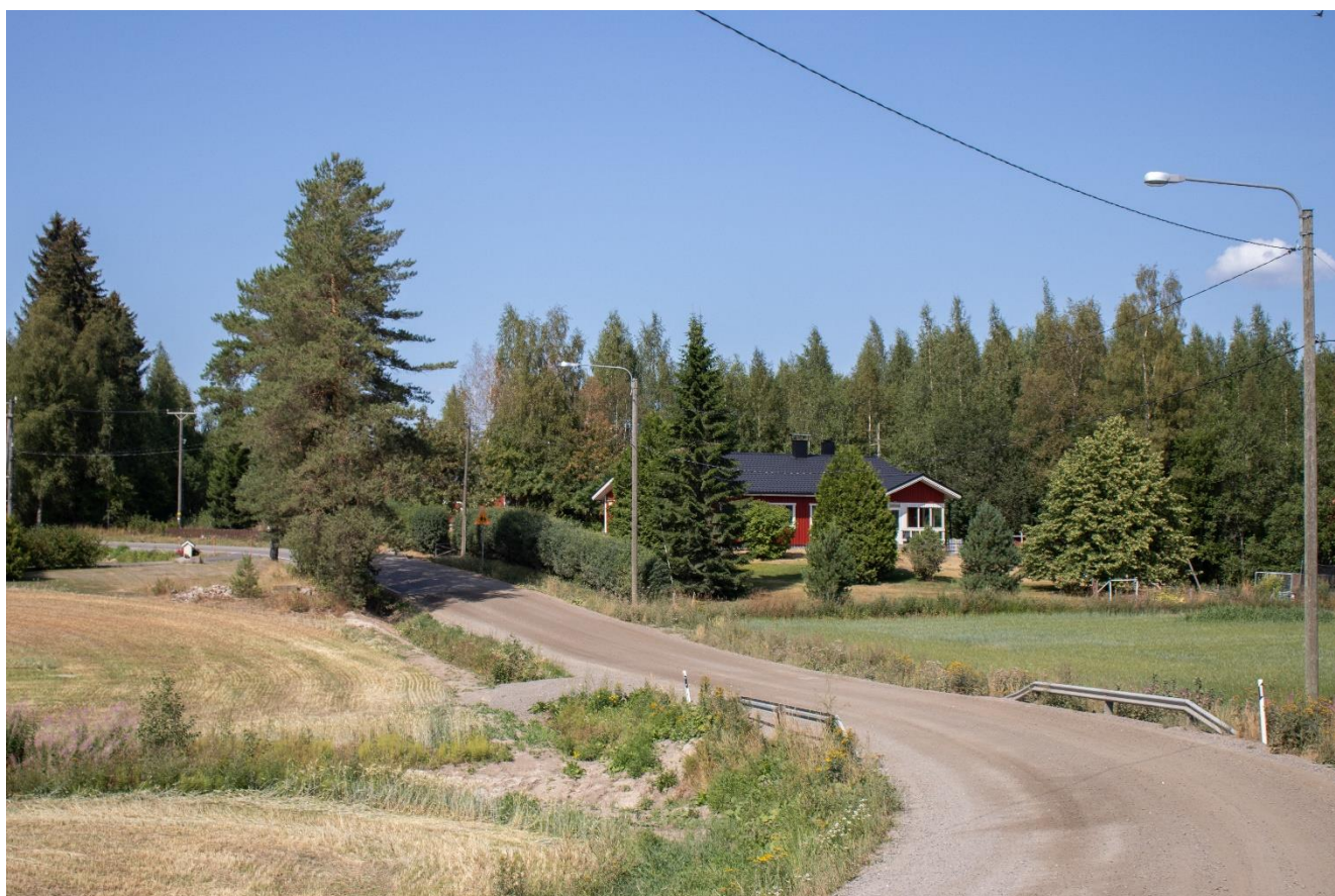
Kuva 3. Korkea-Ahon kylämaisemaa