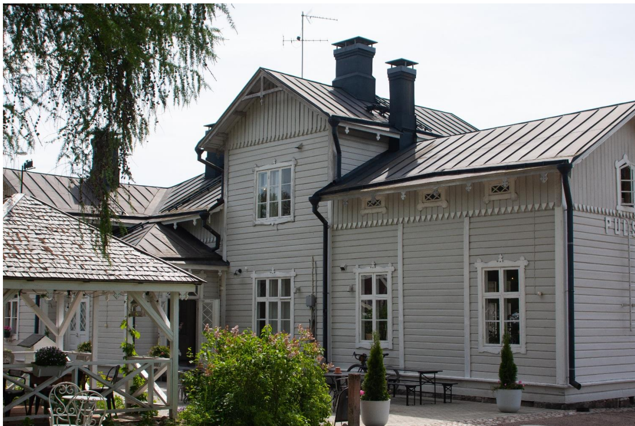
Kuva 2. Pulsan asema

Anola (Lappee), Askolanmäki, Haikala, Hovinkylä, Hytti (Vaalimaantiestä länteen), Hurtanmaa, litiä, Jukkala, Jurkkola Kanalampi, Kankaanranta, Karhunkylä, Korkea-aho, Kukkola, Kärki, Lavonen, Lensula, Louhimo, Maajärvi, Melkkola, Moisio, Myllylä, Myllymäki, Mökkikylä, Nuuteroinen, Nyrhilä, Pesu, Pieni-Kuukka, Pohjonen, Pottikylä, Pukinkylä, Pulsa, Raippo, Ravattu, Sipari, Tani, Turkkila, Tuuva, Törölä, Varis-Lavola, Vihtonen, Vilkjärvi.