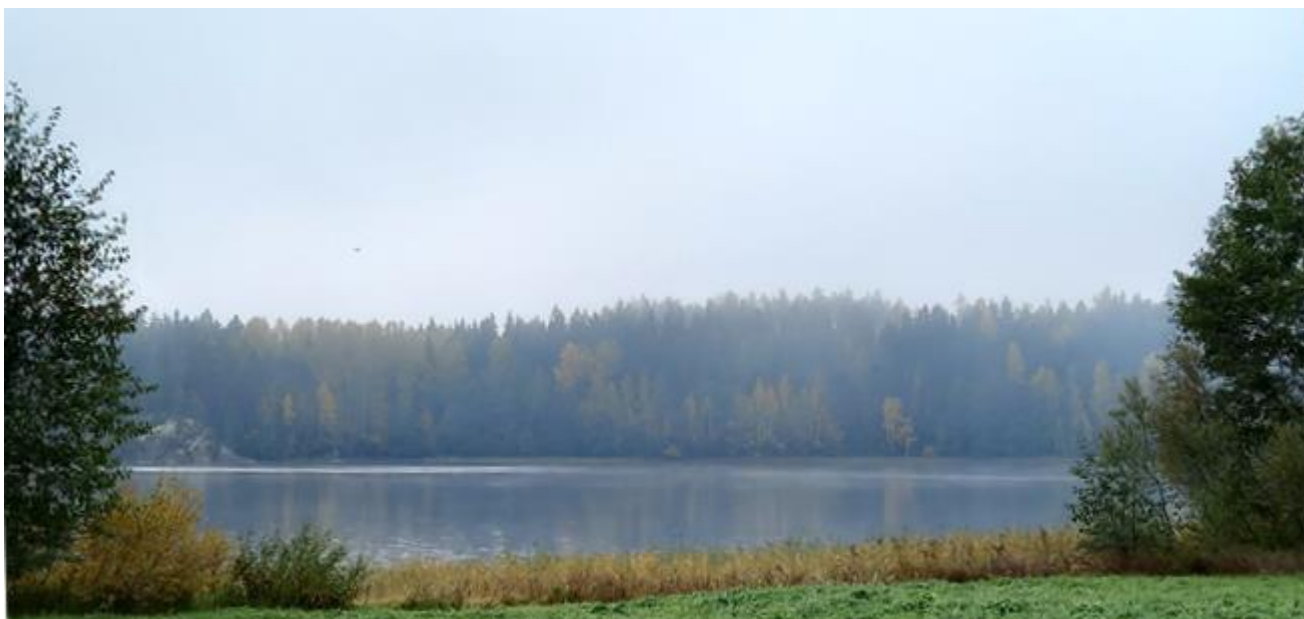
Kuva 4. Suuri Pyhäkala

Osallistumis- ja arviointisuunnitelmaa täydennetään ja tarvittaessa muutetaan suunnittelun edetessä.